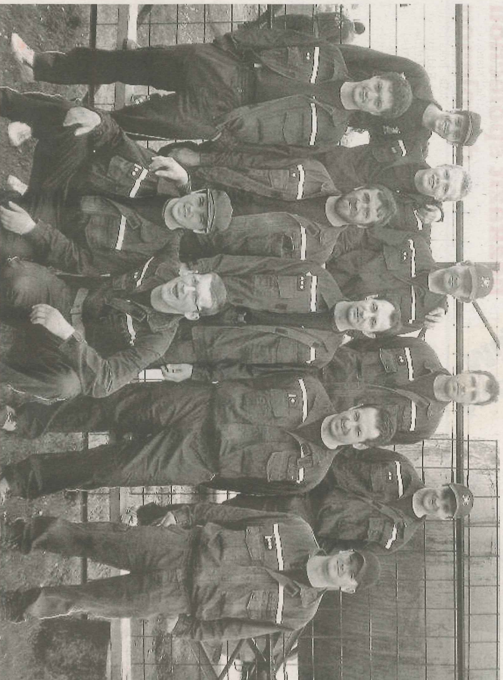
SOUTĚŽ V LOMU. Z okřskového klání dobrovolných hasičů si libějické družstvo mužů II přivezlo ocenění za třetí místo.

Na druhou stranu, kdyby byla avie, musela by už být i nová hasičárna. Stará zbrojnice totiž nevyhovuje svoji velikosti už nyní. Samostatně stojící hasičárna v centru obce si hasiči před několika lety sami zrekonstruovali. Ale náfukováci není. Musí se do ní vejít hasičská výzbroj i vy-